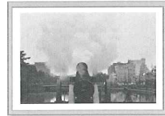
▲優秀賞 「体にひびく祝砲」