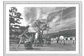
優秀賞▶ 「城内に響く太鼓」