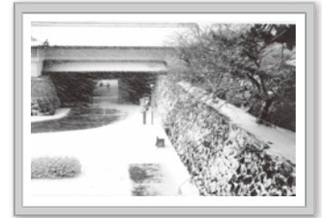
▲優秀賞 「佐賀城門雪景」