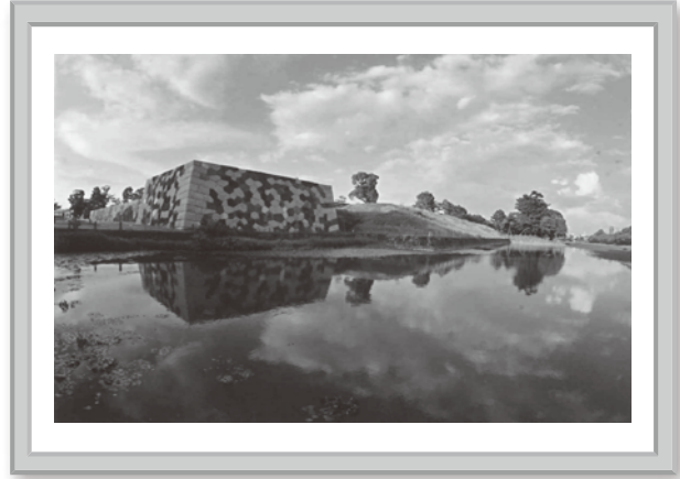
▲最優秀賞 「水面に映る石垣」