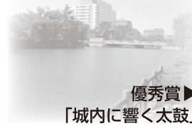
優秀賞▶ 「城内に響く太鼓」